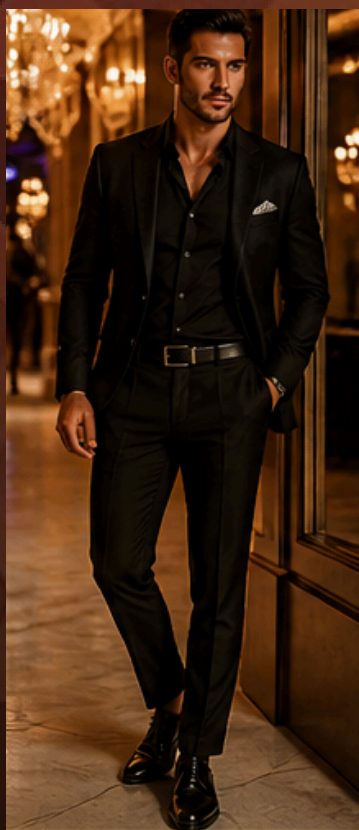
ALL BLACK Elegante, sofisticado e atemporal.