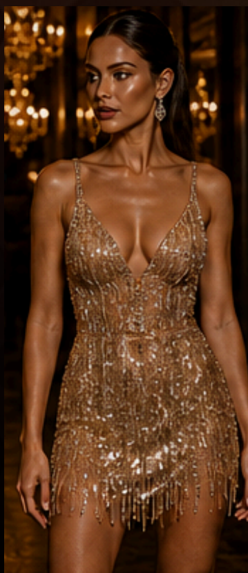
BRILHO & LUXO Paetês, metalizados e texturas que refletem o espírito de vegas.