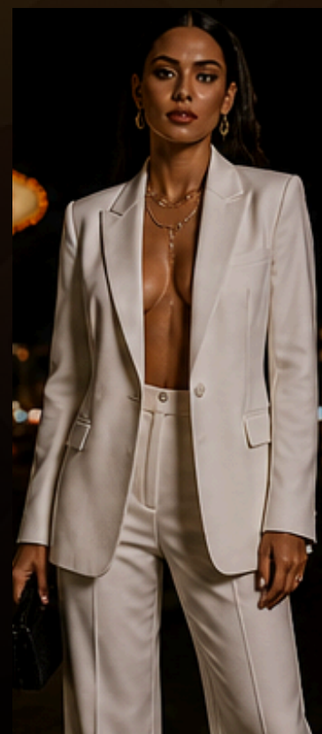
ALFA FEMININO Alfaiataria feminina para quem quer marcar presença com elegância e poder.