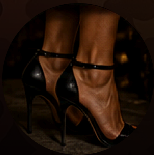
SALTO ALTO (RECOMENDADO)