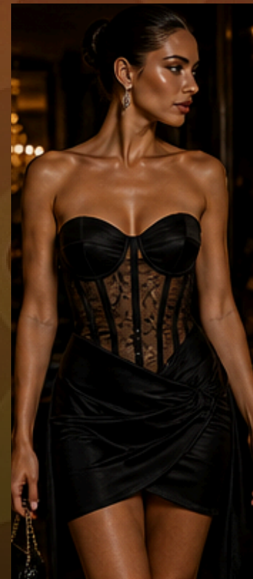
OUSADIA CHIC Recortes, fendas e recidos que valorizam com elegância e sensualidade.