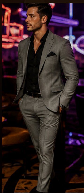
BLAZER Para um visual mais alinhado e sofisticado.