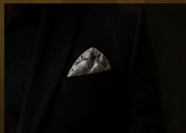
LENÇO DE BOLSO