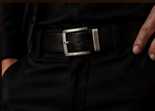
CINTO DE COURO