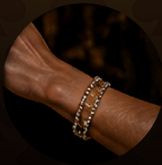
PULSEIRAS E DETALHES