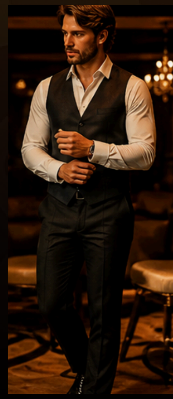
COLETE Estilo e personalidade na medida certa.